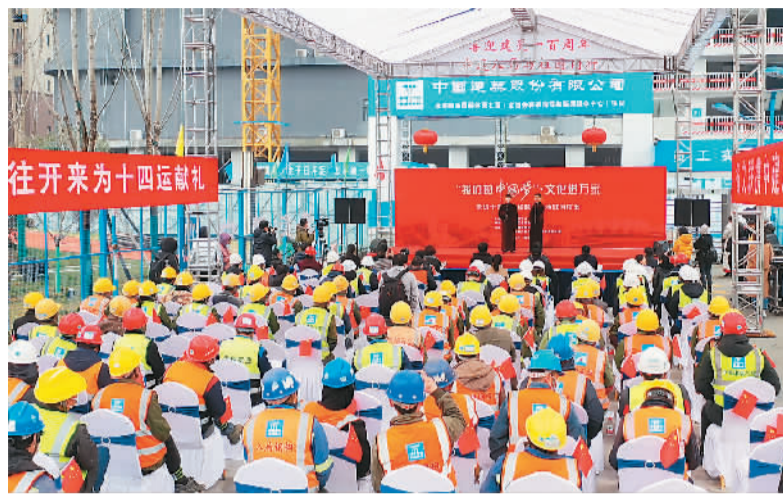
2月26日，文化进万家文艺志愿服务走进陕西国际体育之窗项目工地。该项目由中建八局西北公司承建，是2021年第十四届全运会配套项目。春节期间，项目的千余名建设者“就地过年”，奋战在施工一线。

国务院国有资产监督管理委员会日前发布的数据显示，“十三五”期间，中央企业资产总额连续突破50万亿元、60万亿元关口，去年底为69.1万亿元，接近70万亿元，年均增速达到7.7%。国务院国有资产监督管理委员会主任郝鹏指出，“十三五”期间，中央企业交出了一份比较优异的成绩单。今年提出了中央企业的经营目标，就是要推动中央企业净利润、利润总额增速要高于国民经济的增速，营业收入利润率、研发投入强度、全员劳动生产率都要有明显提高，同时还要保持资产负债率的稳健可控。引导企业更加突出主责主业，聚焦提质增效、聚焦改革创新，确保更好地实现高质量发展。