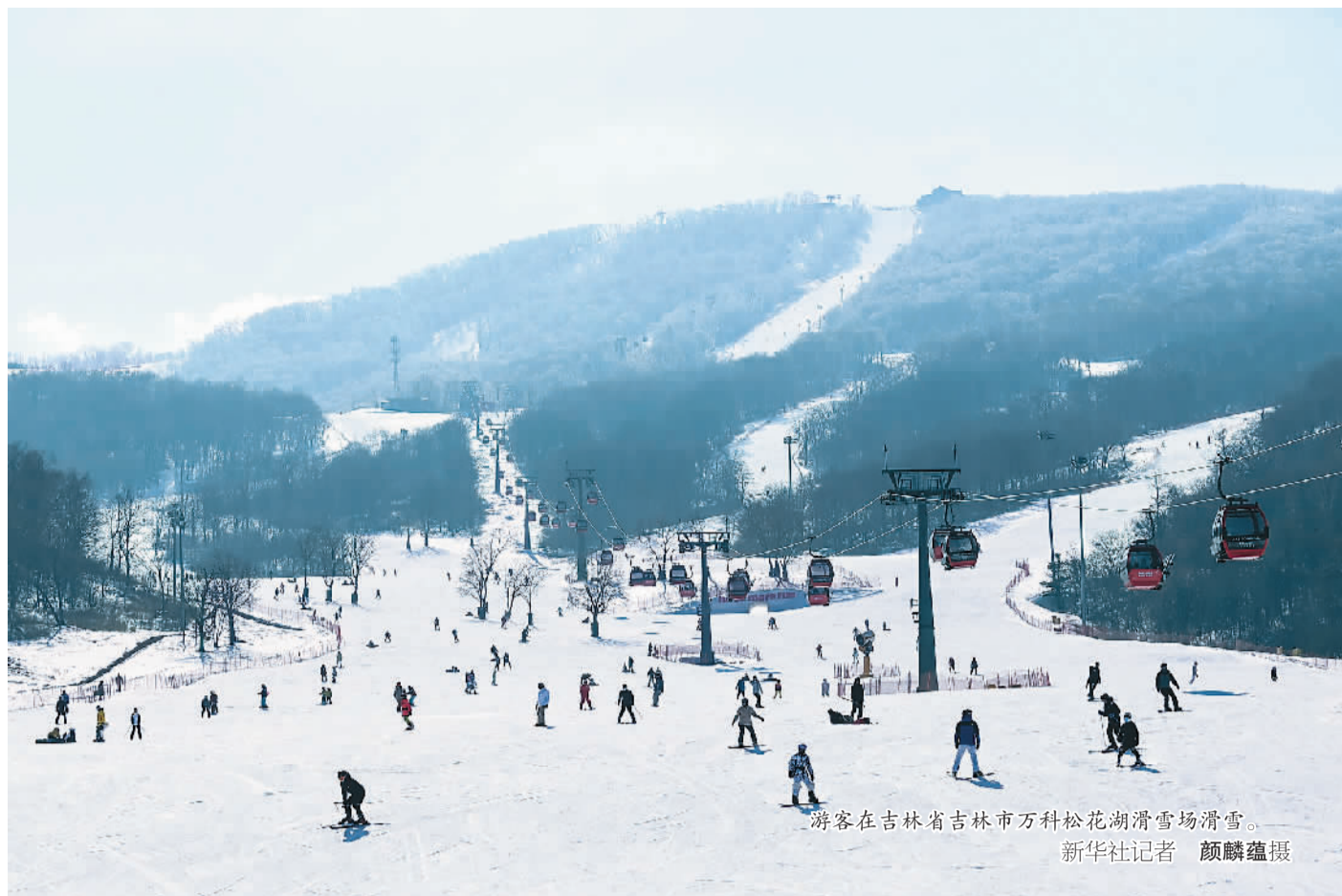
游客在吉林省吉林市万科松花湖滑雪场滑雪。

从即日起,本版推出“冬奥足音”栏目,聚焦北京冬奥会筹办的新进展,讲述中国冰雪的精彩故事。