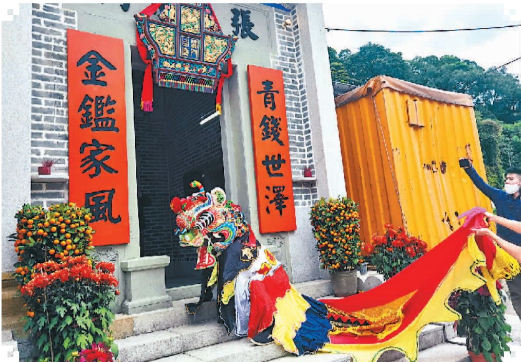
图为“舞麒麟”表演队到村内宗祠表演。