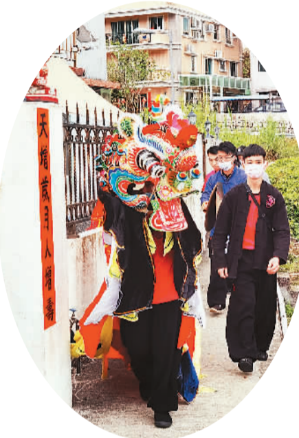
图为“舞麒麟”表演队走街串户。