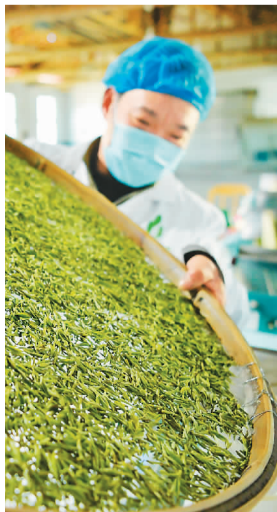
湖北省宣恩县万寨乡一家茶叶加工厂的制茶技师在加工茶叶。