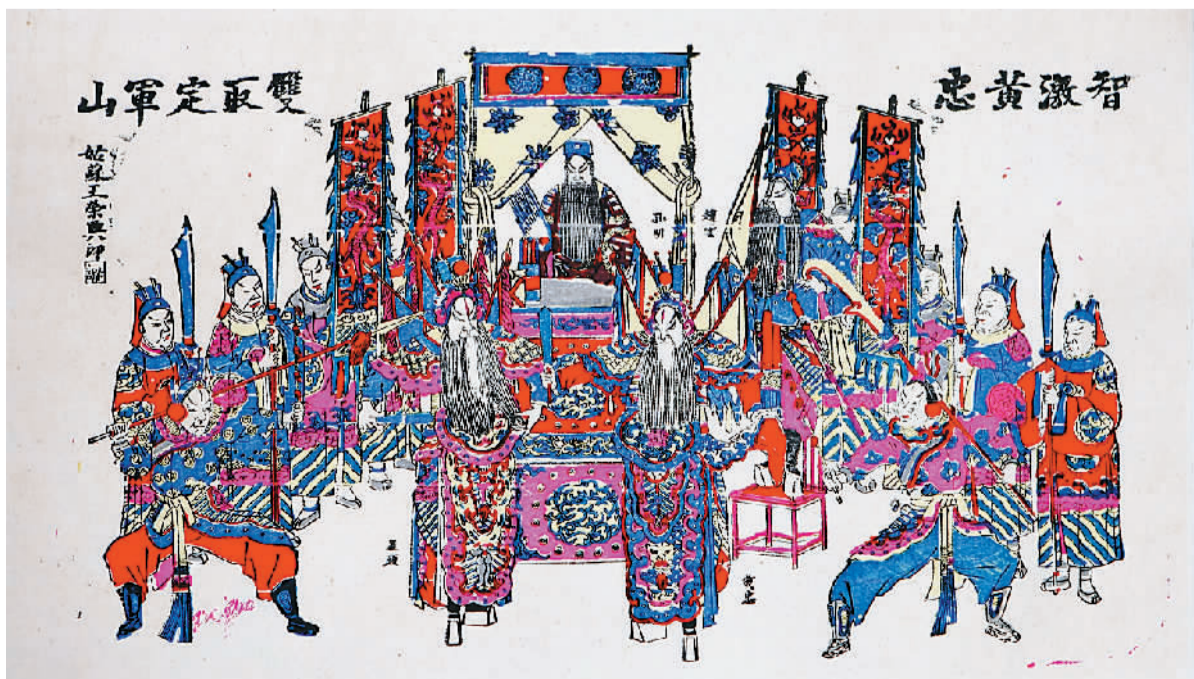
定军山(年画) 清代 江苏苏州

本报电(记者赖睿)中华艺术宫跨年贺岁大展“幸福是奋斗出来的——艺术家作品中的人民主题表达”日前开幕。500多件展品来自中华艺术宫(上海美术馆)馆藏和中国美术馆、湖北美术馆、上海中国画院、刘海粟美术馆、上海油画雕塑院、张充仁纪念馆、丁聪美术馆等机构以及艺术家自藏的部分重要作品。