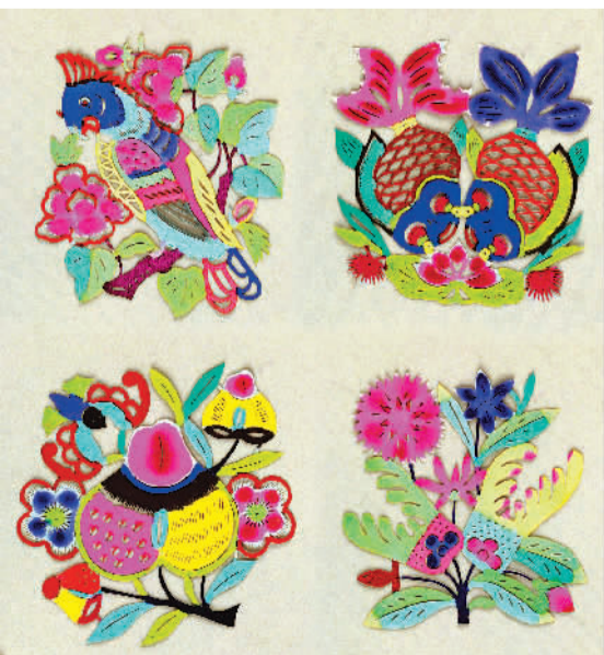
花鸟(剪纸) 现代 河北蔚县

祭灶时间，北方多为腊月二十三，南方多为腊月二十四。是日，向贴在厨壁上的灶王爷敬香祭拜，民间常用糖瓜涂在灶王爷的嘴上，希望灶王爷多向玉帝美言，