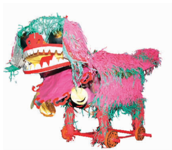
狮子灯(花灯) 现代 北京 黄松青