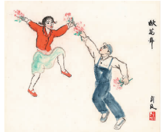
献花舞(轴)(中国画) 关良

“展览作品以上海本土美术创作为主，既有壮阔史诗的观感，也充满了人间烟火气。足够大的形式跨度和时代跨度，也体现出中国城市的发展变迁。”李晓峰说。