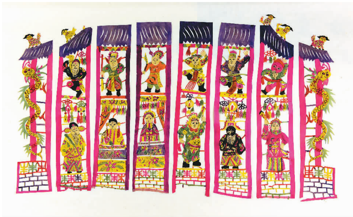
戏曲故事(窗花) 清 山东烟台

“爆竹声中一岁除，春风送暖入屠苏。千门万户瞳瞳日，总把新桃换旧符。”在年复一年的岁月更替中，民间美术总是以最新鲜、最热闹、最丰富的面貌出现在新春佳节的习俗与庆典上。在装点节日和娱乐大众的同时，也在坚守和传承着古老的文化。民间美术以喜闻乐见的形式表达群众纳福迎祥的普遍心理，在社会快速发展的当下，依然在民间习俗和日常生活中发挥着不可替代的作用。