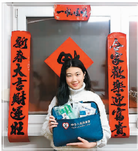
在德国哈勒维滕贝格—马丁路德大学就读的中国学生收到了使馆发放的“春节包”。