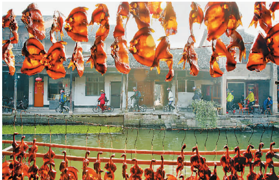
安昌古镇里腊味飘香。

到了阳光宜人的午间,到临河的古镇酒家找个空位坐下,点上一份鲜咸适口的腊肠、酱鸭、清蒸鱼干以及一碟茴香豆、一盘梅干菜烧肉,外加一壶黄酒,就能在挂满腊味的檐廊下,偷得浮生半日闲,惬意地体味安昌古镇的腊月风情。