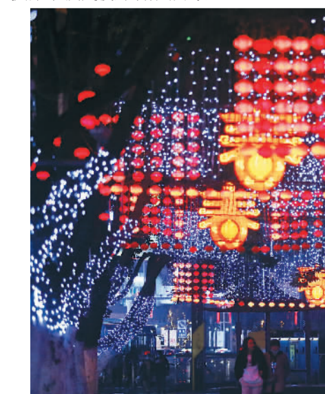
贵阳街头点亮新春彩灯,年味渐浓。

吃过年夜饭,全家人动手和面包饺子,饺子包成元宝形,当地人俗称“揣元宝”。煮饺子时,锅底烧的是“杏条”柴,因“杏”与“兴”谐音。锅内水沸时,舅舅在灶间高喊:“日子起来了!”屋里屋外的家人高声应答:“起来啦!”随着这一声喊,锅里的饺子一个个从锅底浮了上来。除夕夜,满乡灯火通明,家家灯光彻夜不灭,人们在家中吃饺子、唱民族歌谣、表演民族舞蹈,共同守岁。