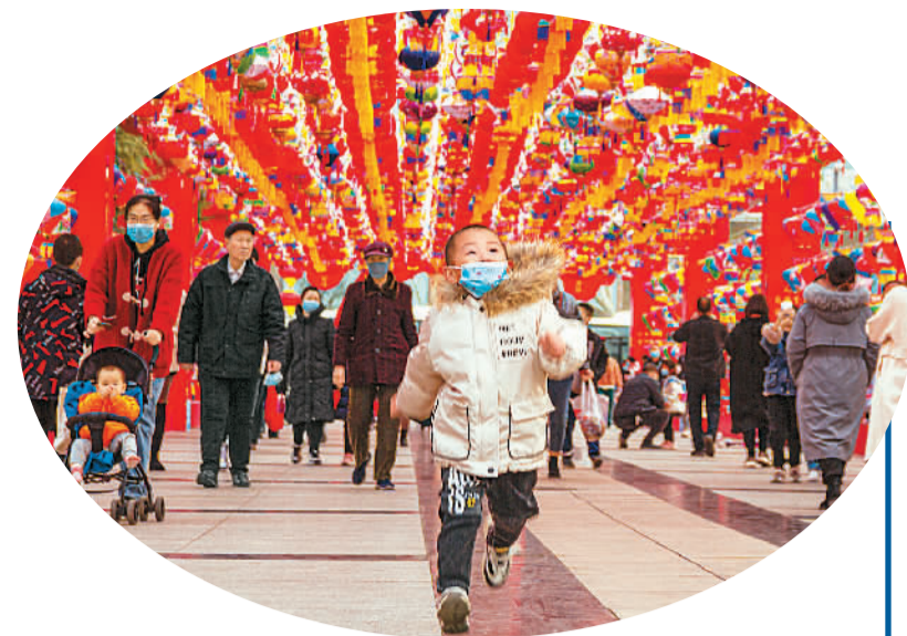
市民在山西运城南风广场欣赏花灯。

特的地位,它代表着亲情、传承和归属感。每年春运,30亿人次大迁徙,跨越千山万水只为回家,正是中国人一年一次情感大迸发的体现。但中国人也深深知道,每一个小家都与国家密不可分。家是最小国,国是千万家。从“有钱没钱回