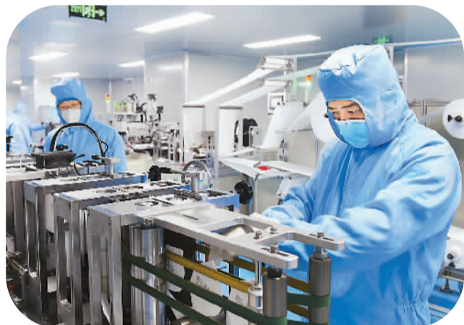
春节前夕，位于安徽六安经济技术开发区的安徽佳宝防护用品有限公司，工人们正在加班加点，确保按时完成海外口罩订单。