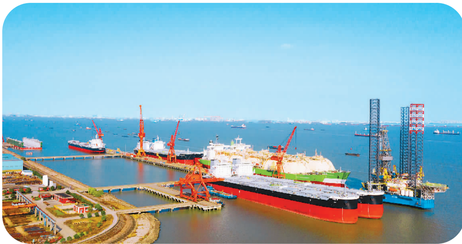
2020年12月9日，江苏省太仓港经济技术开发区一家造船企业码头，主体建造完工的船舶进入装配、调试阶段，即将交付国内外船东。

不久前，商务部发布了2020年国家级经开区综合发展水平考核评价的有关情况。总体来看，218家国家级经开区总量扩大、结构优化、效益和质量提升、开放带动作用增强，正在构建新发展格局方面发挥更大的作用。