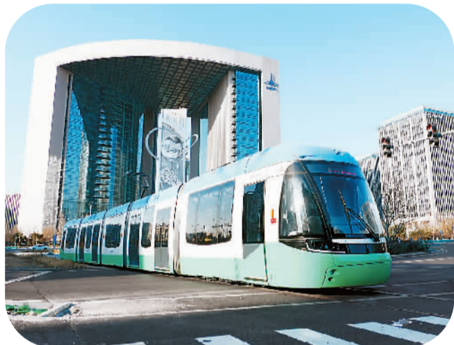
不久前，北京亦庄的T1线正式开通试运营，贯穿亦庄经济技术开发区各大产业基地和重要功能区。

国家级经济技术开发区内投资设厂。“举例来说，早在1995年，霍尼韦尔就在天津经济技术开发区投资建立了独资工厂——霍尼韦尔（天津）有限公司。另外，霍尼韦尔的特种材料和技术、安全与生产力解决方案和航空航天等三个业务集团均已落户苏州工业园区。”霍尼韦尔（中国）总裁张宇峰对本报记者表示，通过在国家级经开区的一系列投资，霍尼韦尔“东方服务东方”“东方服务世界”等发展战略得以实现，不仅以一系列