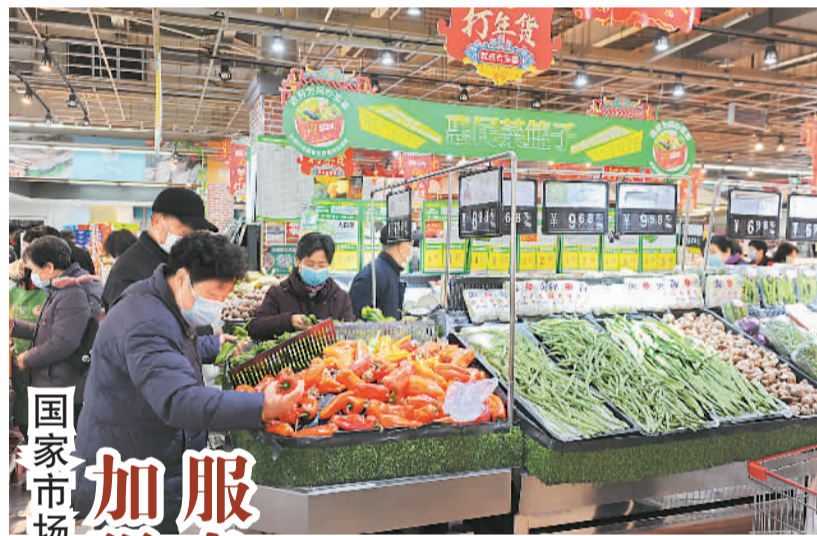
国家市场监督管理总局