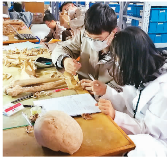
前沿科技“让考古遗存开口说话”

北大考古文博学院在动植物考古学以及文物材料科学分析等方面处于国内领先地位，其考古年代学达到国际