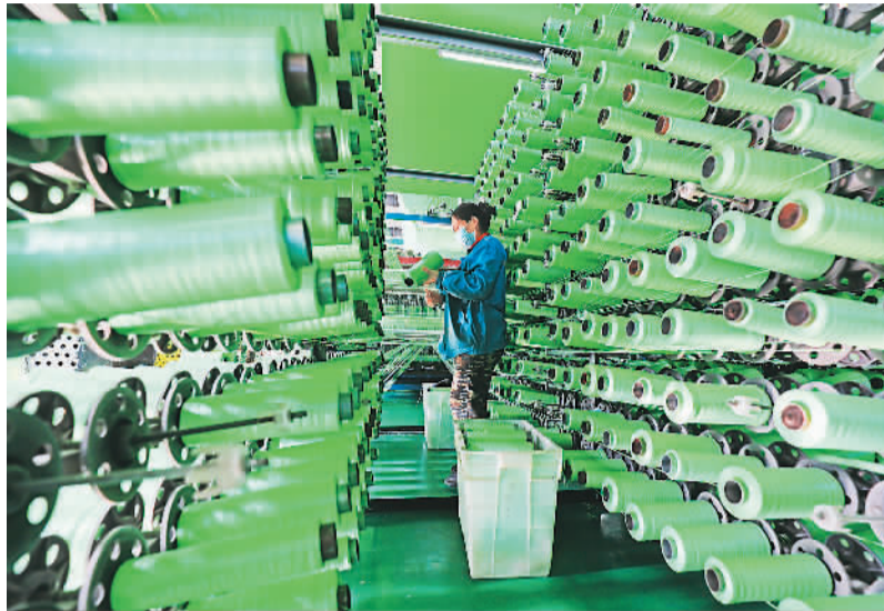
目前，河北省唐山市滦南县共有科技型中小企业392家，高新技术企业36家，成为引领县域经济增长的新引擎。图为工人在位于滦南县的唐山昊远包装有限公司生产线上工作。