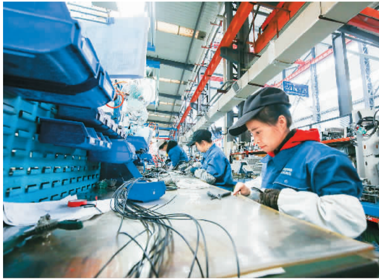
江苏思源赫兹互感器有限公司日前入选国家工业和信息化部公示的第二批专精特新“小巨人”企业名单。图为工人在该企业生产线上忙碌。

日前，财政部、工业和信息化部联合印发《关于支持“专精特新”中小企业高质量发展的通知》，明确中央财政安排100亿元以上奖补资金，支持“专精特新”中小企业高质量发展。专家指出，《通知》的出台为推动中小企业高质量发展指明了方向、注入了动力。