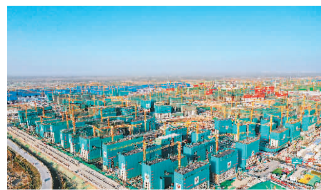
图为河北雄安新区容东片区安置房项目建设现场。

与2019年相比，2020年雄安新区各类POI（兴趣点）的数量增长显著。其中，医疗和汽车服务类POI数量增长均为30%，美食类POI数量同比增长24.7%，企业类POI的增长则达到7.41%。这从侧面反映建设大军的涌入带动了当地的消费需求和消费能力。去年，雄安金融和企业类功能区域增加了7.12%，消费类功能区域增加了27.34%，城市服务能力显著提升。