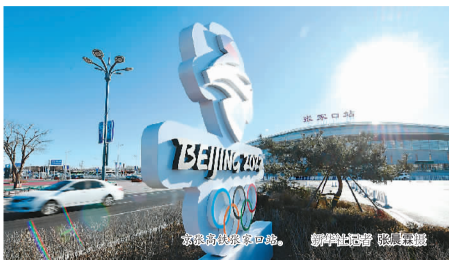
京张高铁张家口站。

站在时间节点之上，中国冰雪的脉搏越发强烈。回首来路，北京冬奥从申办到筹办进展顺利，“中国速度”令世人瞩目；面向前方，奥运圣火持续升温，“双奥之城”正静待八方来客，努力为世界奉献一届精彩、非凡、卓越的奥运盛会。