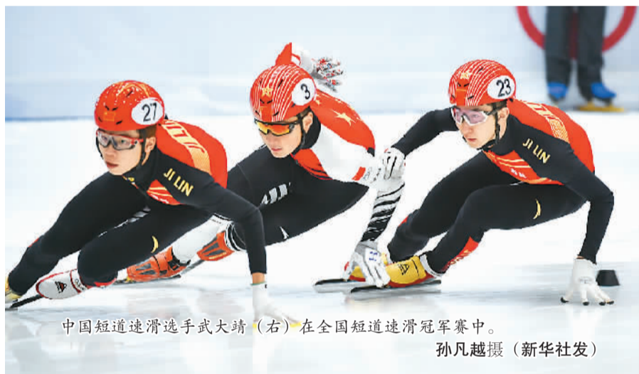
中国短道速滑选手武大靖（右）在全国短道速滑冠军赛中。