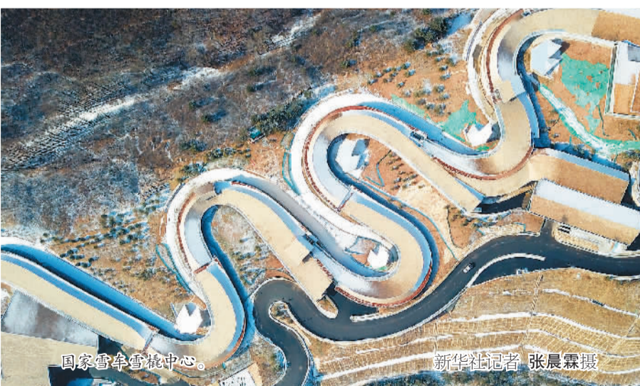
国家雪车雪橇中心。