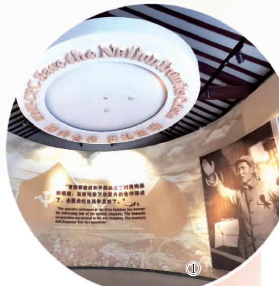
图①：西安事变史实陈列室内场景。