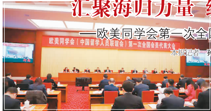
1月21日—22日，欧美同学会（中国留学人员联谊会）第一次全国会员代表大会在京举行。

1月21日，欧美同学会（中国留学人员联谊会）第一次全国会员代表大会在北京召开，这是这家有着百年历史的全国性留学人员组织自成立以来的首次全国会员代表大会。