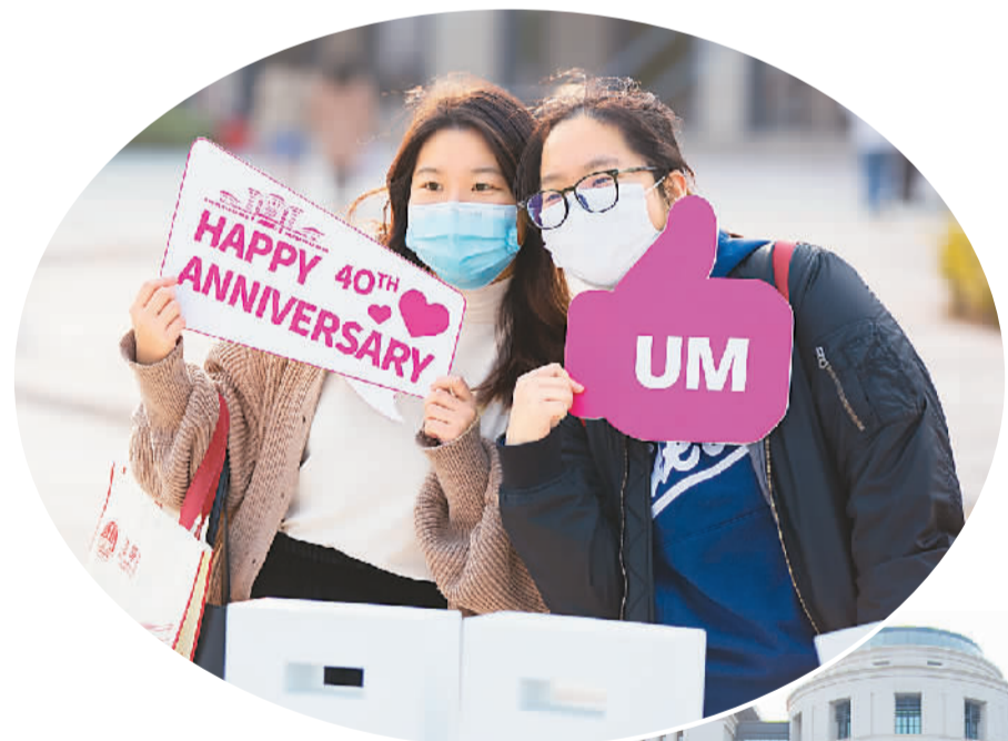
上图:市民手举澳门大学校庆标志合影留念。

香港贸发局副局长周启良说,去年书展网站增设“文化在线”专区,上传了10多年来约140个书展的讲座片段,包括金庸、白先勇、几米、林青霞等名人或作家。