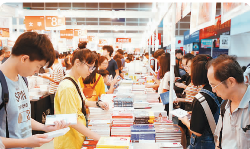
香港书展往年热闹非凡,吸引不少读者前来选购书籍。

在当日举行的校庆启动仪式上,澳门特区政府官员、中央驻澳机构代表、教育界人士、澳大教职员、学生、校友等聚首澳大图书馆广场为校庆揭开序幕,分享澳大建校40周年的喜悦。