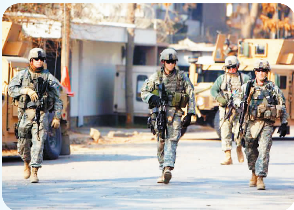
美军士兵在阿富汗首都喀布尔街头巡逻。(资料图片)

近年来，美国白宫不断发布“撤军令”：2018年12月，宣布撤回驻叙利亚美军；2020年6月，宣布大幅裁减驻德国美军；9月至11月，几次设定从伊拉克和阿富汗撤军时间表。2011年底，美国从伊拉克撤军，仅留少量驻军。2020年2月，美国政府与阿富汗塔利班签署协议。美方承诺在135天内把驻阿美军从大约1.3万人缩减至8600人，剩余的美军和北约联军士兵将在14个月内（2021年5月前）撤离阿富汗。2020年11月，米勒宣布，美国在阿