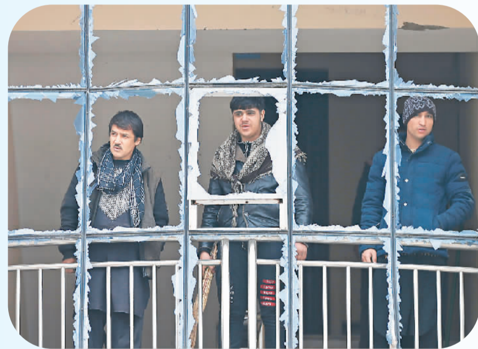
右图：2020年12月20日，在阿富汗喀布尔，人们从爆炸袭击现场的受损建筑内向外看。