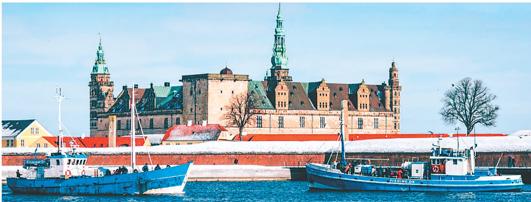
丹麦北西兰岛的卡隆堡宫。

采访结束前，我们追问大使2021年的工作计划，他表示，很遗憾2020年没能到中国更多省市走一走、看一看，希望2021年有更多机会见到多元的中国。大使特别提到，安徒生博物馆将于2021年在丹麦欧登塞落成，“届时我们将在丹麦举办一个展览，也会邀请丹麦艺术家来中国。”