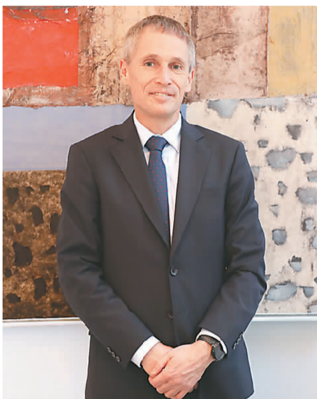
丹麦驻华大使马磊近照。

马磊高度关注中国的政策走向，在他看来，全球绿色低碳转型的成功离不开中国的努力。2020年9月22日，中国国家主席习近平在第七十五届联合国大会一般性辩论上郑重宣布，中国将采取更加有力的政策和措施，二氧化碳排放力争于2030年前达到峰值，努力争取2060年前实现碳中和。对此，马磊深感钦佩：“这对其他国家来说是一个强有力的信号，对中国而言则是一个勇敢的举动，因为要实现这个目标殊为不易。”他表示，作为世界碳排放量最