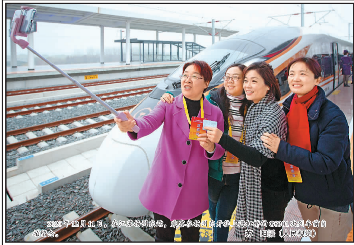
2020年12月11日，在江苏扬州东站，乘客在扬州东站乘坐上海虹桥的G3801次列车前合影留念。