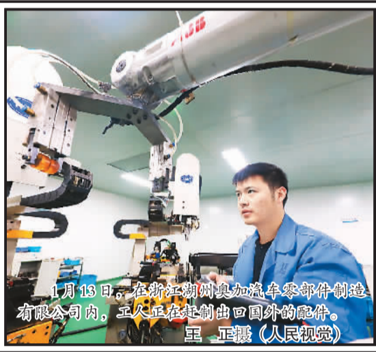
1月13日，在浙江湖州奥加汽车零部件制造有限公司内，工人正在定制出回国的配件。