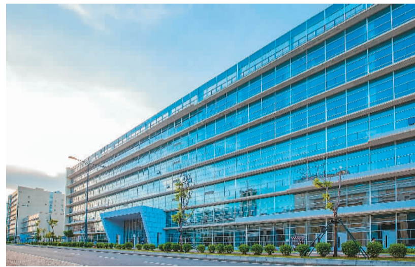
近日，澳门大学获国家正式批准立项建设“精准肿瘤学前沿科学中心”。这是国家在港澳地区布局的首个前沿科学中心，将围绕癌症的发生与发展、肿瘤微环境与免疫调控、癌症转移及耐药机制、高效药物开发及癌症个体化治疗四个方向开展前沿科学研究工作。图为“精准肿瘤学前沿科学中心”外景。