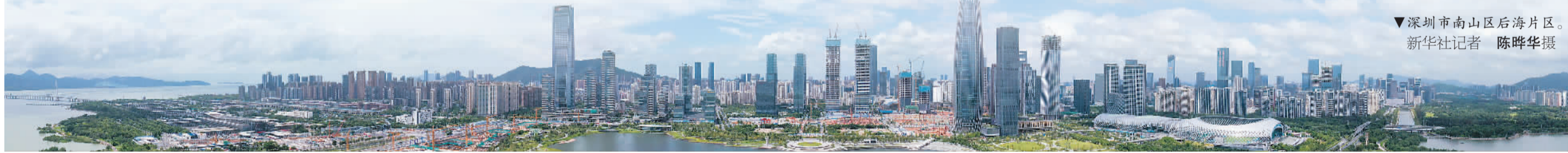
深圳市南山区后海片区。

强调经济发展与环境保护并重。调整方案指出，为贯彻落实《固体废物污染环境防治法》，2021年1月1日起，相应取消金属废碎料等固体废物进口暂定税率，恢复执行最惠国税率。“随着国内经济的发展，建设生态文明、环境保护优先、保障公众健康已经成为社会共识。前几年中国已经禁止进口各类电子垃圾了，也是出于这方面的考虑。” 张