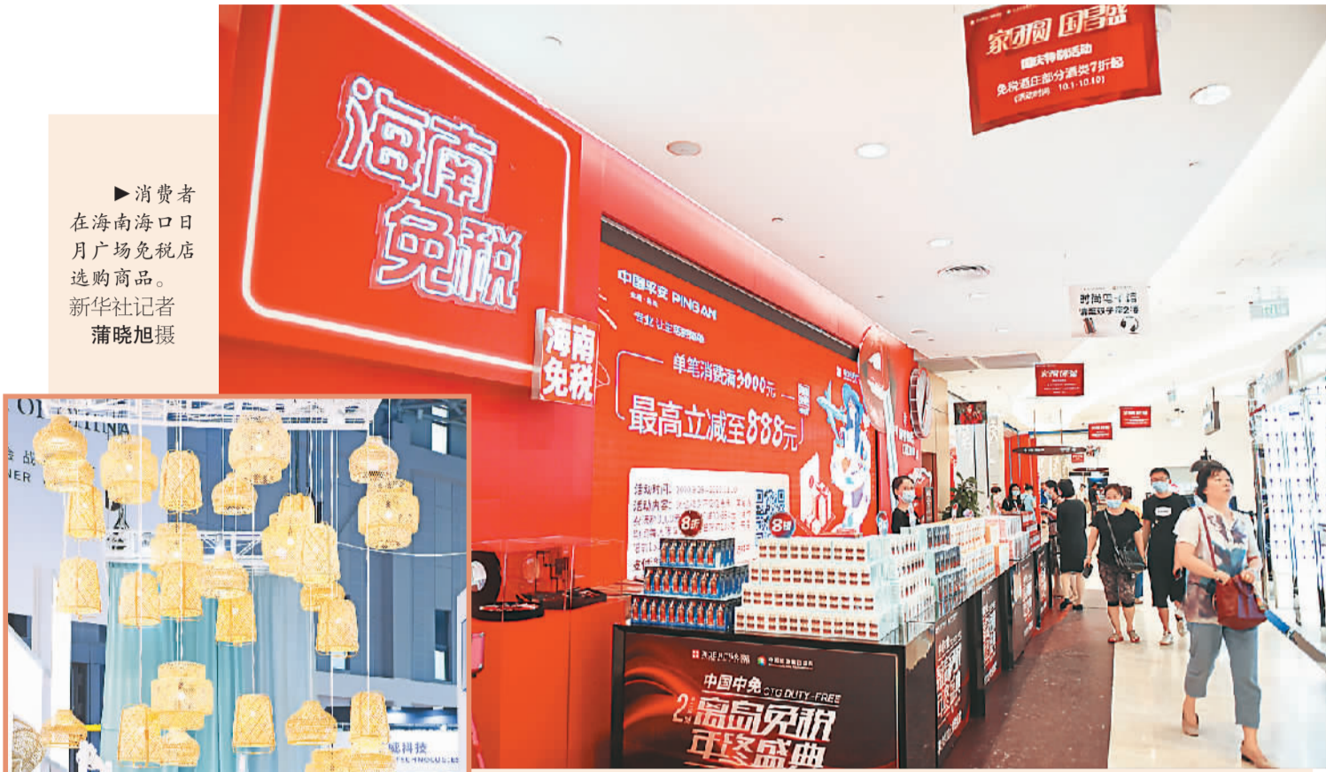
消费者在海南海口日月广场免税店选购商品。

进入2021年，中国再次调整进口关税，送出惠民生和促经济的政策“礼包”。根据国务院关税税则委员会通知，自今年1月1日起，中国对883项商品实施低于最惠国税率的进口暂定税率。