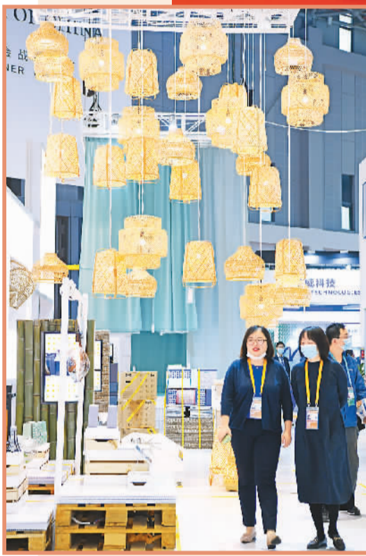
第三届中国国际进口博览会上，宜家展品引人注目。