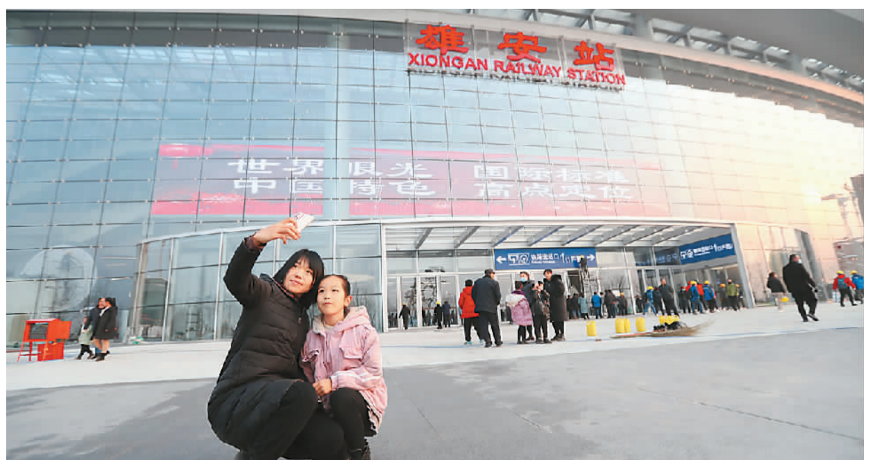
2020年12月26日，当地居民与雄安站合影。