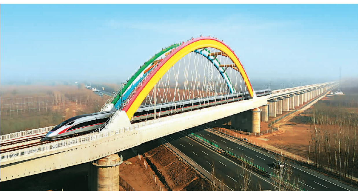
复兴号驶过“彩虹桥”——京雄城际铁路霸州特大桥。

千年大计，交通先行。未来，雄安站将成为中国“八纵八横”高铁网的新枢纽，京雄城际铁路将与京港高速铁路、津雄城际铁路、雄石城际铁路、雄忻高速铁路在雄安站交会，为京津冀地区长远发展和雄安新区建设注入新的活力。京雄城际铁路必将成为“中国智造”的又一典范，不断向世界展示中国发展的加速度和新时代下的新风采。