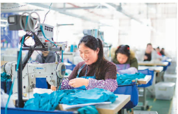
在黔东南苗族侗族自治州榕江县工业园区,搬迁群众在制作衣服。

走进兴义市洒金街道,让人觉得颇有趣味:社区内街巷命名为苹果、枇杷、芭蕉等,而楼栋上则有老虎、熊猫、兔子等动物图案,到了晚上有了光亮更是醒目! 原来,作为兴义市跨县市安置搬迁群众5个居住区最大的一个,洒金街道共安置7482户33327人。街道用老百姓日常接触较多又较易辨识的水果来命名社区巷道,在每栋楼上装饰不同动物图像,并利用LED灯夜晚亮,让群众很容易找到自己的新家。 事实上,为让搬迁群众尽快适应、融入新的城镇生活,贵州结合社会融入的一般规律和自身实际,探索出包括文化服务体系、社区治理体系在内的“五个体系”,全力写好易地扶贫搬迁“后半篇文章”。 位于黔西南布依族苗族自治州安龙县的五福社区也是一处易地扶贫搬迁安置点,总人口超过9500人,许多都是苗族、布依族等少数民族。 木质的犁头、陈旧的石磨、破了洞的储酒罐……为延续乡俗和乡愁,安龙县在包括五福社区在内的所有易地扶贫搬迁安置点,建设民族历史文化馆和乡愁馆,让搬迁居民找到精神寄托。 “我们还成立了文艺宣传队,表演节目包括芦笙舞、板凳舞、八音坐唱等。”五福街道办事处副主任肖亚琪说。 如今,贵州建成易地扶贫搬迁安置点946个,新建和改扩建配套教育项目669所,新建和改扩建基层卫生服务机构440个。通过完善、创新公共服务,搬迁群众正在加速向“新市民”转变。 压题图:贵州省毕节市大方县奢香古镇易地扶贫搬迁安置点。