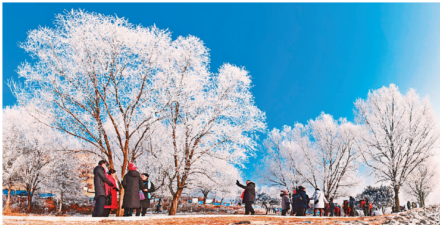
玩转冰雪 乐游吉林 本报记者祝大伟摄