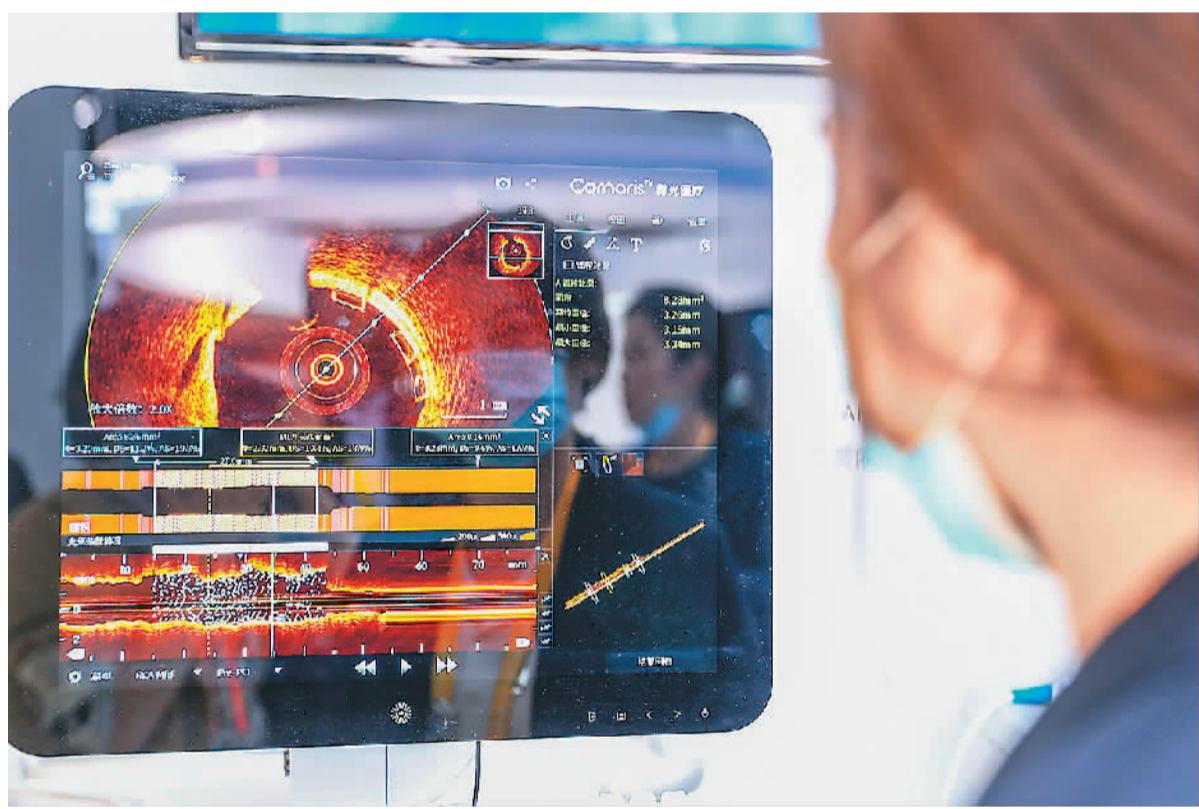
2020年11月6日，第三届中国国际进口博览会上，工作人员在医疗器械及医药保健展区的波士顿科学展台上，展示心血管光学相干断层成像系统。

“一个人哪个地方不舒服，就到医生那儿找相关的疾病，所以出现了头疼医头、脚疼医脚的问题。”对此，葛均波强调，要把人作为整体来看待，心血管疾病其实是血管病，“我们在专业里强调‘泛血管’的概念，或者说泛血管疾病，它是以动脉粥样硬化为主导的疾病，发生在不同的器官，比如发生在大脑，产生脑中风，发生在心脏，产生心肌梗死，发