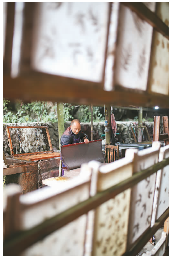
贵州省黔东南苗族侗族自治州丹寨县南寨乡石桥村村民在古法造纸作坊抄制古纸。

“我们的节目没有剧本，发生的所有细节都是真实的，力图将扶贫的故事讲得很新鲜、有特点、更好看。”王鹏说。2018年以来，广东省大力推进“粤菜师傅”工程，让贫困地区的青年凭借手艺获得稳定的收入，走出了一条“色香味”俱全的精准扶贫和乡村振兴之路。据悉，这档节目播出的同时，国强公益基金会及国华人旅同步发起“百城千辆‘食光车’”活动，将来自全国的原生态农副产品通过“食光车”带给消费者，线上线下互动带货助农，真正实现可持续的扶贫模式。