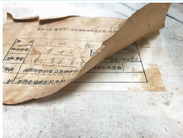
油画《父亲》画布背面标签下发现被覆盖的标签