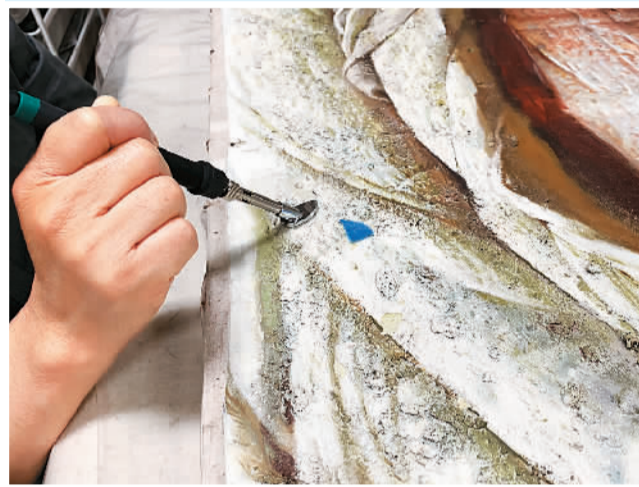
对油画《父亲》做局部加固颜料层