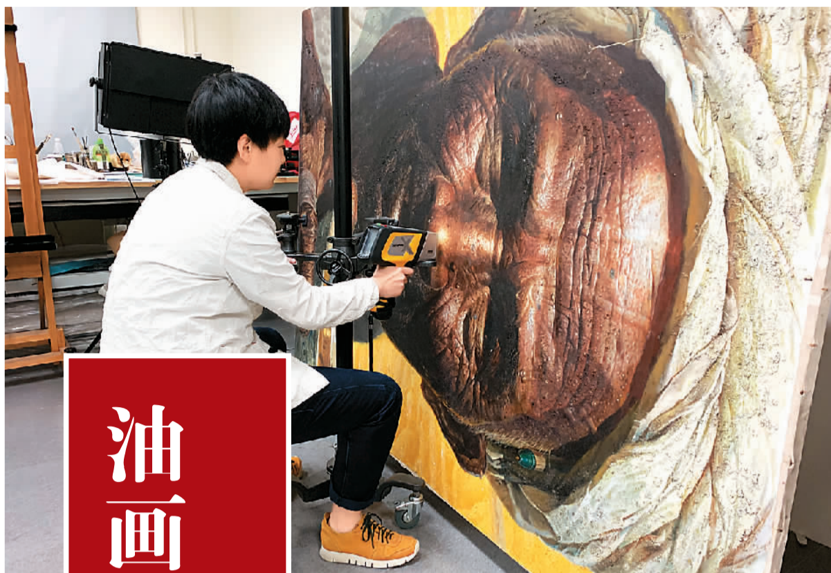
对油画《父亲》做XRF数据采集