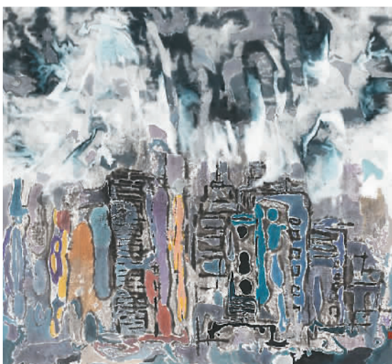
蓄势之城（中国画）游江

“深圳画家画深圳”已连续举办至十六届，通过每年对新涌现的艺术精品创作进行梳理和总结，激励深圳市美术家扎根基层、脚踏实地从事艺术创作。展览尤其能挖掘对深圳本土主题的艺术表达，发现与培养本土美术人才，积极推动深圳文化艺术事业的发展。