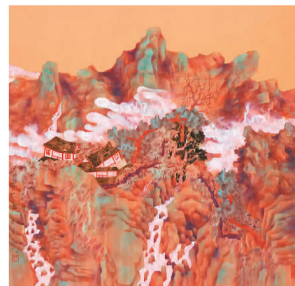
探花信（中国画）牛克诚

中国美术馆馆长吴为山介绍，中国美术馆学术邀请展是中国美术馆为激励创新，为卓有成就的艺术家而设立的展览序列，此前已邀请举办戴士和、刘巨德、钟蜀珩、闫平、王克举、汤小铭、陈坚等艺术家的展览。