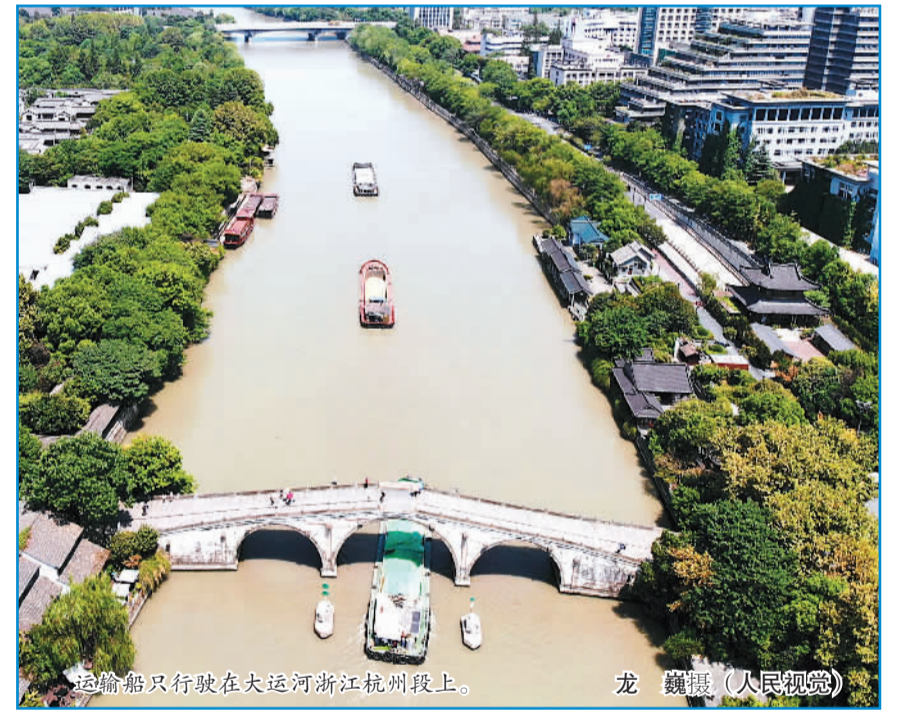
运输船只行驶在大运河浙江杭州段上。