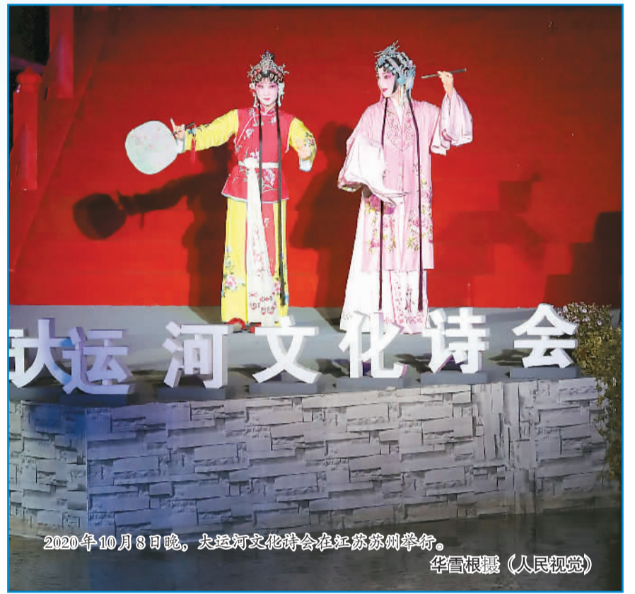
大运河文化诗会在江苏苏州举行。