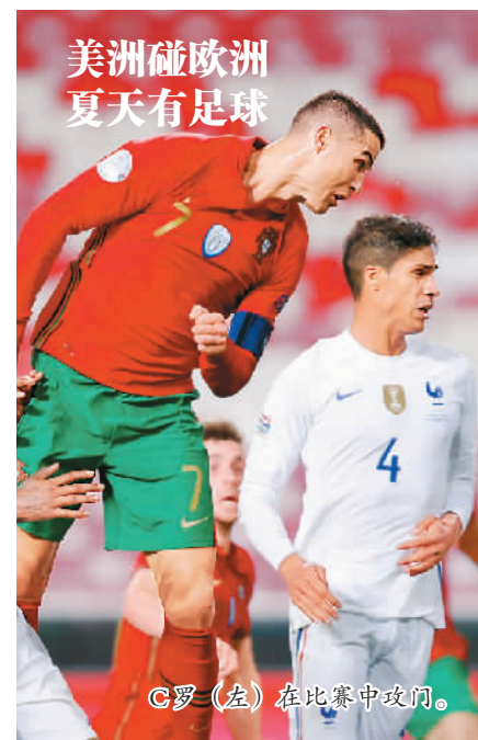
C罗(左)在比赛中攻门。

这是中国第三次举办大学生运动会，也是中国中西部城市首次举办大运会。成都大运会共设置篮球、排球、田径、游泳等18个体育项目。今年4月底前，赛事场馆和大运村建设将全部完工，测试赛和火炬传递等活动也将陆续开启。