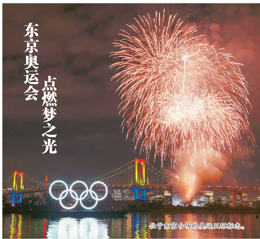
东京奥运会 点燃梦之光