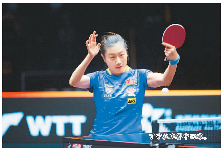
丁宁在比赛中回球。

扣人心弦的奥运会女排比赛将从7月25日开打。中国女排将在小组赛先后同土耳其、美国、俄罗斯、意大利和阿根廷女排交手。值得一提的是，东京奥运会女排决赛安排在最后一天举行。中国女排是否能在奥运压轴大戏上笑到最后？这是今年中国体育的最大看点之一。