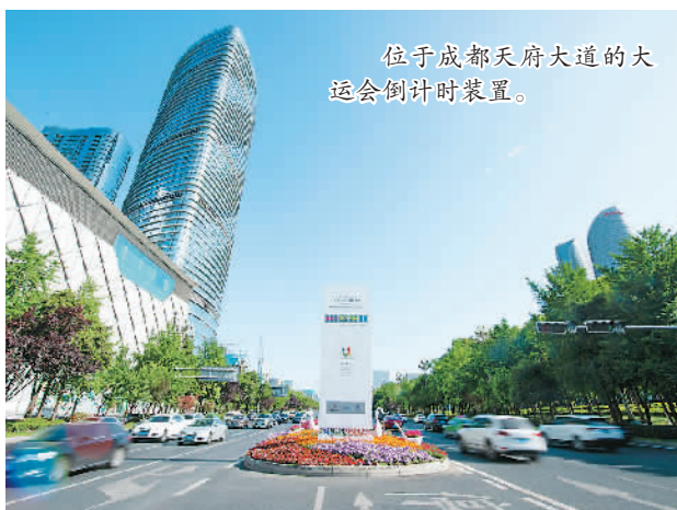
位于成都天府大道的大运会倒计时装置。

按照乒乓球世界排名新规，WTT大满贯将成为与世乒赛和奥运会地位齐平的赛事。这也意味着，如果原定于美国休斯敦举行的单项世乒赛能够如期上演，乒乓球“三大赛”将在今年扎堆，国乒队员的表现值得期待。