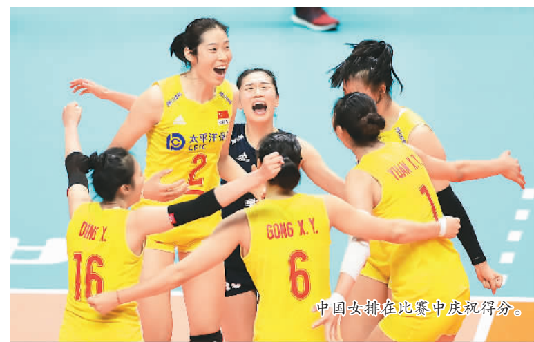
中国女排在比赛中庆祝得分。

奥运再启、大赛扎堆，这是一个迟来的、充满希望的体育大年，也是一个未知的、未必如愿的体育大年。人类同疫情的斗争远未到终点，很多赛事仍面临着无法正常举行的风险。但只要有一丝光亮，前行的脚步便不会停止，这便是体育的精神和力量。