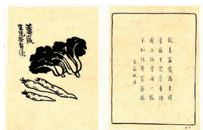
《护生画初集》手稿，浙江省博物馆藏

此次展览是继不久前结束的“2020北京·中国弓弦艺术节”后，国戏与国博战略合作的又一项新举措。据悉，展览大约持续2个月。