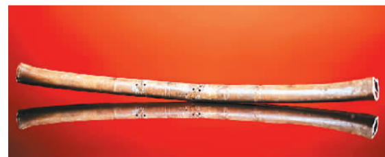
河南博物院“镇院之宝”贾湖骨笛