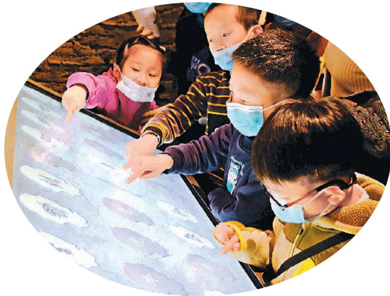
左图：小朋友们在河南博物院体验触屏设备。右图：观众欣赏“泱泱华夏·择中建都”基本陈列展出的金缕玉衣。