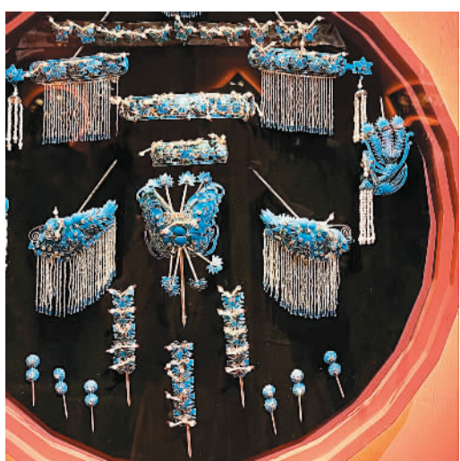
展厅里的点绸头面

熠熠生辉的戏服、弥足珍贵的黑胶唱片、五光十色的舞台剧照……2020年12月26日，由中国国家博物馆与中国戏曲学院联合主办的“薪火相传——