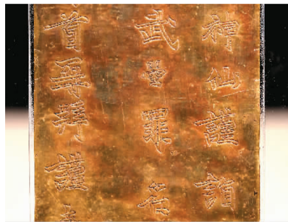
河南博物院“镇院之宝”武则天金简（局部）

主展馆试运行期间观众没能看到的“镇院之宝”云纹铜禁，在“丹浙吉金——中原楚国青铜艺术”展中亮相。春秋时期，丹浙流域是楚文化滥觞之地，楚人在此留下了丰富的文化遗存。这次展出的浙川东周楚墓青铜器，以其富丽纹饰和精湛工