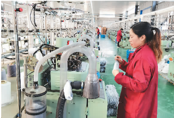
近期，湖北省十堰市房县工业企业生产一片繁忙，赶制耳罩、纺织、防护服等一批农产品，销往多个国家。图为1月3日，在位于房县白鹤镇赤岩村的房县卓琳袜业有限公司，工人正在生产棉袜。