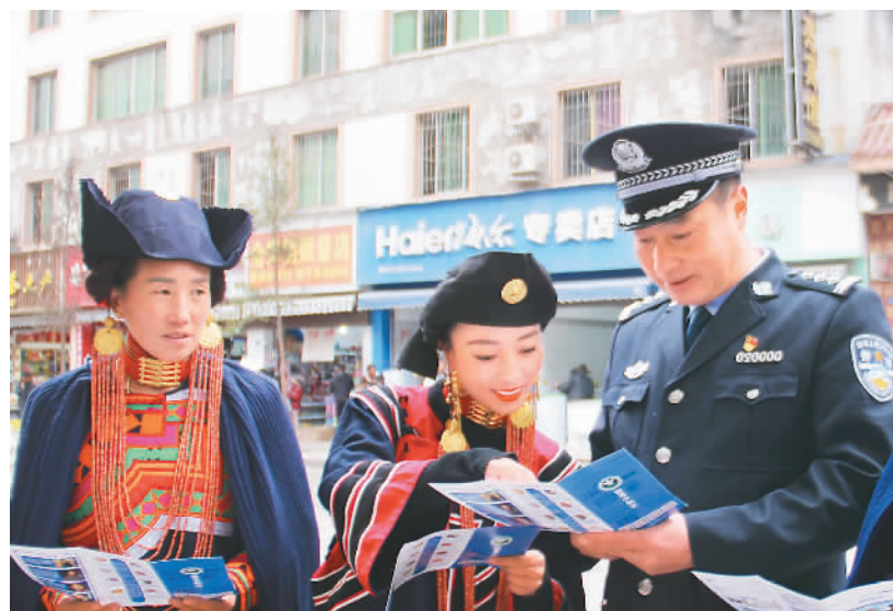
新年伊始,四川省凉山彝族自治州美姑县委禁毒办、县公安局深入边远山区开展禁毒法治宣传教育活动,为当地百姓讲解禁毒和脱贫攻坚相关政策。图为1月4日,美姑县委禁毒办和公安民警在街头进行禁毒法治宣传。