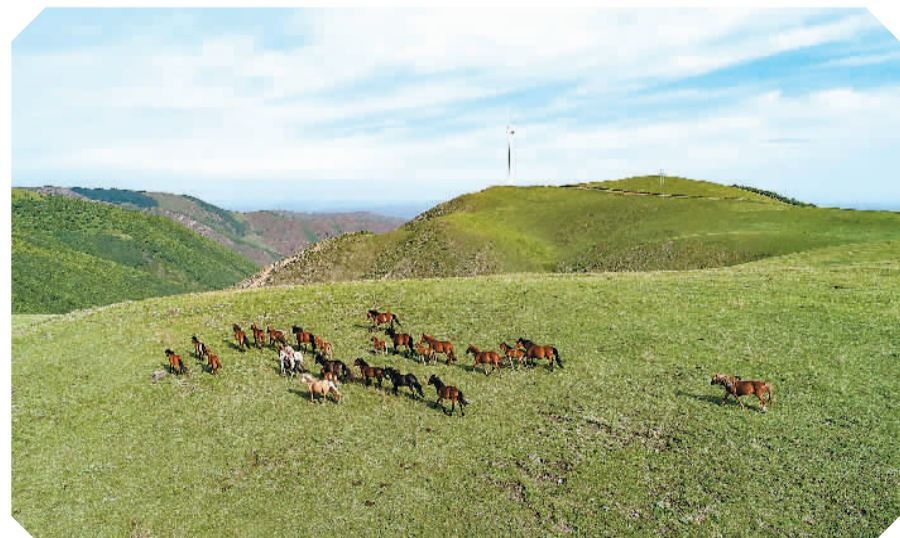
内蒙古乌兰察布辉腾锡勒草原美如画。