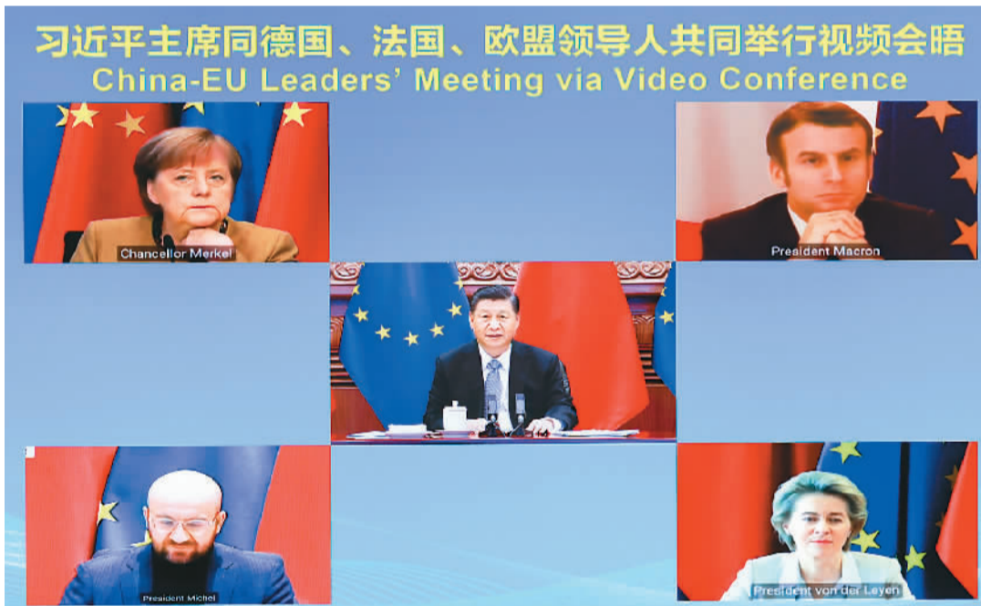
左图:12月30日晚,国家主席习近平在北京同德国总理默克尔、法国总统马克龙、欧洲理事会主席米歇尔、欧盟委员会主席冯德莱恩举行视频会晤。中欧领导人共同宣布如期完成中欧投资协定谈判。