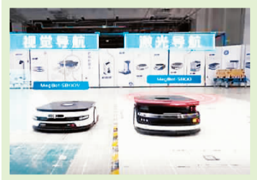
由旷视科技研发的智慧物流机器人。

与此同时，人社部等部门联合发布9个新职业。新就业形态、新就业岗位的不断出现，给予了海归更多选择。事实上，自2019年以来，人社