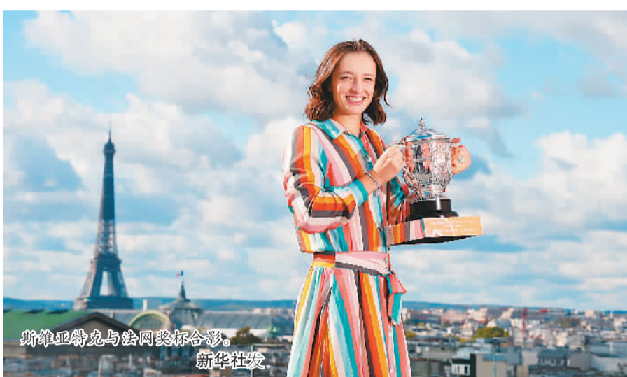
斯维娅特克与法网奖杯合影。

所有过往，皆为序章。 2020年的新冠肺炎疫情，极大地改变了世界体育的面貌，也让体育人在艰难之中怀揣希望，寻找火光所在。 新的一年即将到来。在变与不变中，那些愿望会实现吗？不妨让我们展开畅想。