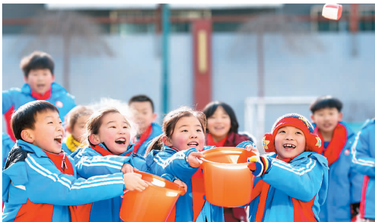
内蒙古呼和浩特市玉泉区通顺街小学学生在玩沙包抛接游戏。

所有过往，皆为序章。 2020年的新冠肺炎疫情，极大地改变了世界体育的面貌，也让体育人在艰难之中怀揣希望，寻找火光所在。 新的一年即将到来。在变与不变中，那些愿望会实现吗？不妨让我们展开畅想。