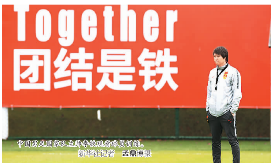
中国男足国家队主帅李铁观看球员训练。