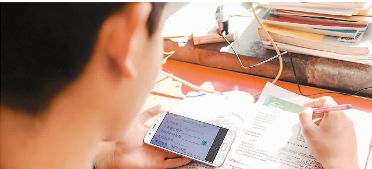
一名学生在家中上网课。