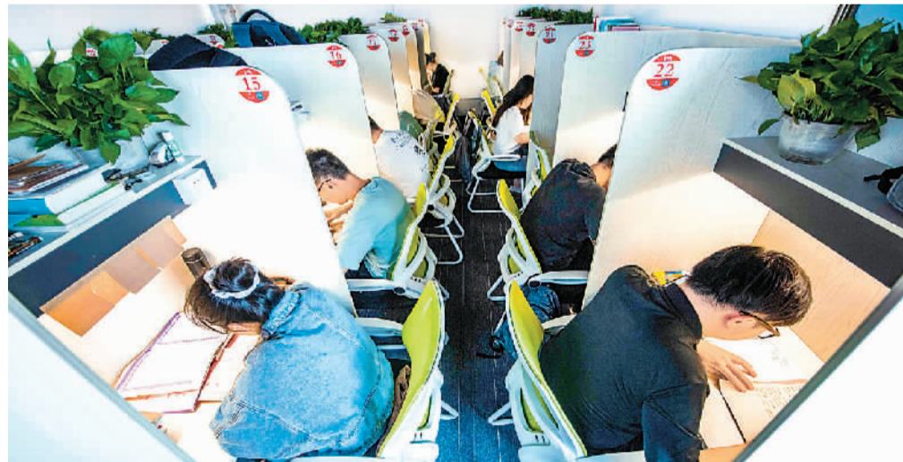
人们在山东省青州市知北游共享自习室学习。

过去，黄涵也曾到周边学校“蹭”自习室，或去公共图书馆学习。然而，防疫期间很多学校都封闭了，“离我家最近的图书馆根本预约不上”，她只好开始“花钱买座位”，好在共享自习室一小时10