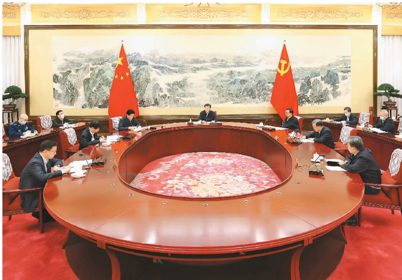
12月24日至25日,中共中央政治局召开民主生活会,中共中央总书记习近平主持会议并发表重要讲话。