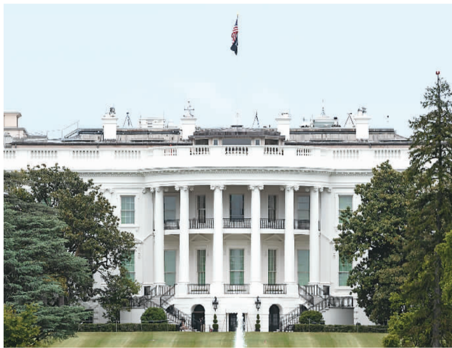
图为美国白宫。5月21日,美国国务院称,美国将于次日向《开放天空条约》所有签约国递交退约决定通知。

据《华盛顿邮报》报道,美国国务院日前通知美国国会,将永久关闭美国驻俄罗斯符拉迪沃斯托克的总领事馆,并临时暂停驻乌拉尔山以东叶卡捷琳堡总领事馆的运作。据悉,这是美国在俄罗斯的最后两座领事馆,在它们关闭之后,美国在俄罗斯的唯一外交机构就只剩美国驻俄罗斯大使馆。对于美国的决定,俄方回应称,此举显示出两国关系后退的迹象。