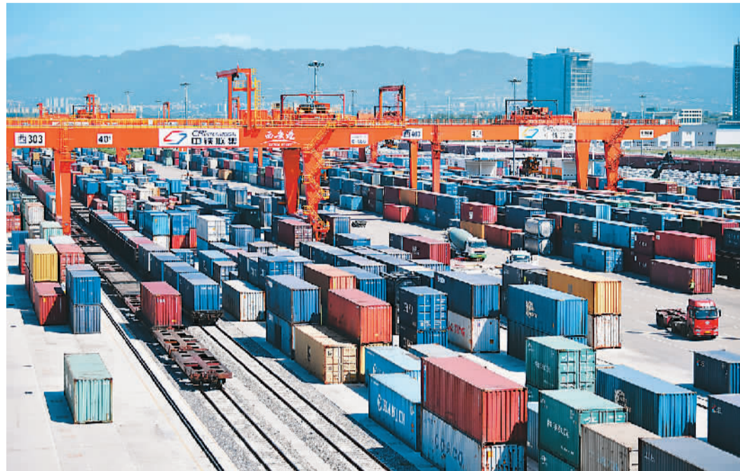
“长安号”中欧班列在西安新筑站内装卸集装箱。

外媒对此广泛关注并作出积极预测：中国经济平稳复苏为2020年动荡中的全球经济增添一抹亮色，中国经济持续增长有望为2021年全球经济复苏提供强劲驱动力。