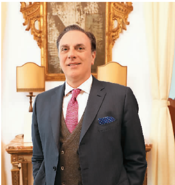
意大利驻华大使方澜意近照。

在中意建交50周年之际担任意大利驻华大使，方澜意是两国关系发展的见证者和推动者。方澜意近日在接受人民日报海外网采访时谈及对意中关系的展望：未来意中经贸合作将越来越密切，人文交流将不断拓展，两国拥有丰富的文化和旅游资源，意中旅游合作大有可为。