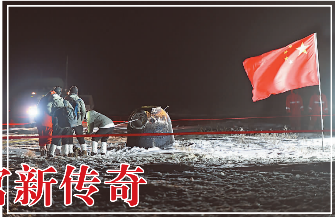
12月17日凌晨，嫦娥五号返回器携带月球样品，采用半弹道跳跃方式再入返回，在内蒙古四子王旗预定区域安全着陆。

结束23天的探月行程，完成月球“挖土”、月面起飞、月球轨道无人交会对接等任务“打卡”——嫦娥五号的传奇之旅，不仅为揭开“月宫”秘密带回了“礼物”，更为中国人的探月之梦奠定基础。