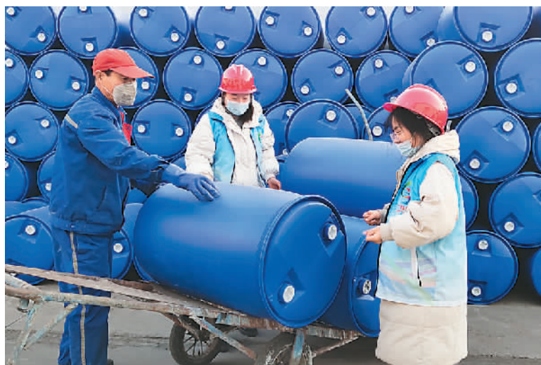
12月16日，山东省东营市广饶县大王镇企业专属网格员正在对企业人员开展安全隐患警示教育。筑牢基层治理基石，切实维护企业合法权益。