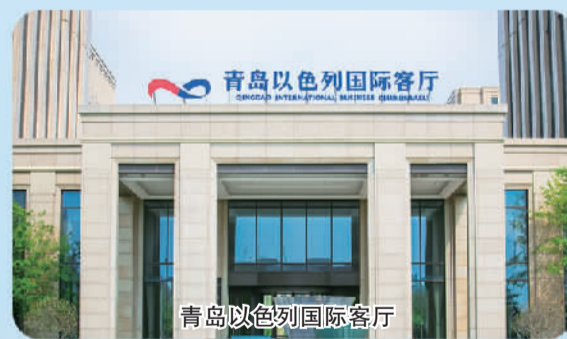
青岛以色列国际客厅