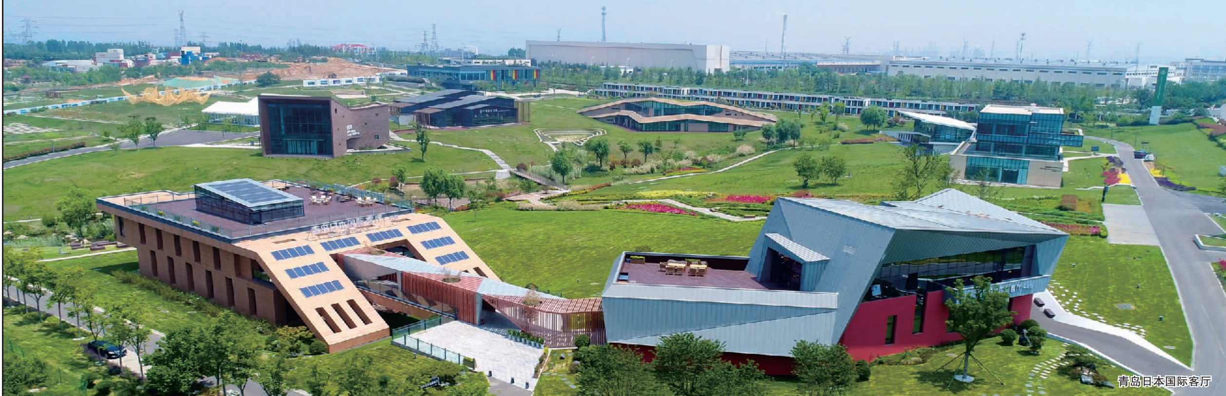
青岛日本国际客厅