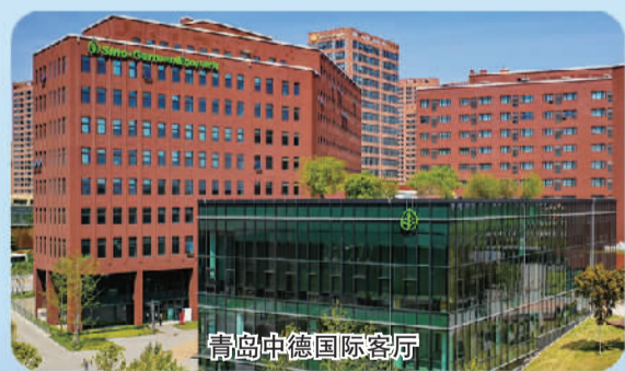
青岛中德国际客厅