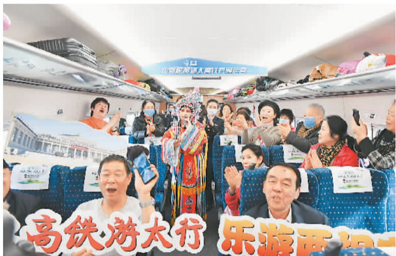
郑太高铁首发车上，旅客们在欣赏文艺演出。

在江苏淮安，未来周末及节假日定制型高铁旅游专列将常态化，并开发配套的周恩来故乡等红色旅游主题项目，同时，积极打造当地的旅游目的地品牌；连云港则提出要围绕高铁旅游，丰富旅游产品，优化旅游公共服务，提升游客体验；郑太高铁沿线城市也将借助高铁的辐射作用，推动当地现代旅游业的提质、升级。