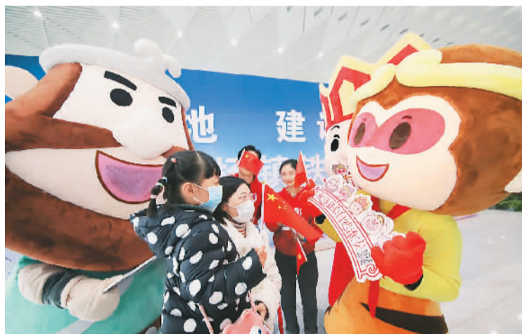
连淮扬镇高铁全线开通仪式上，西游记主题人偶与旅客互动。

就整个江苏省而言，连淮扬镇高铁的通行，将苏北的连云港、淮安以及苏中的扬州、苏南的镇江联系起来，极大地方便了江苏省内人员的往来。同时，也将连云港、淮