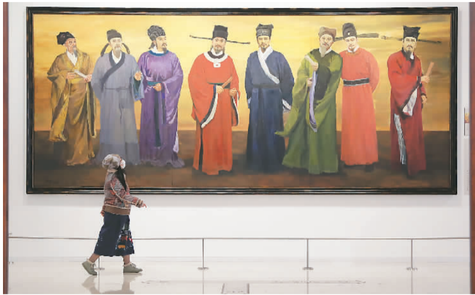
“山高水长——唐宋八大家主题文物展”现场

12月2日，“山高水长——唐宋八大家主题文物展”在辽宁省博物馆开幕。作为本年度最值得期待的展览之一，“唐宋八大家主题文物展”吸引着来自各地的观众走进辽博，通过文物感受八大家绵延千年的文脉和雄唐雅宋的时代风采。