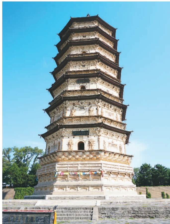
呼和浩特万部华严经塔外观