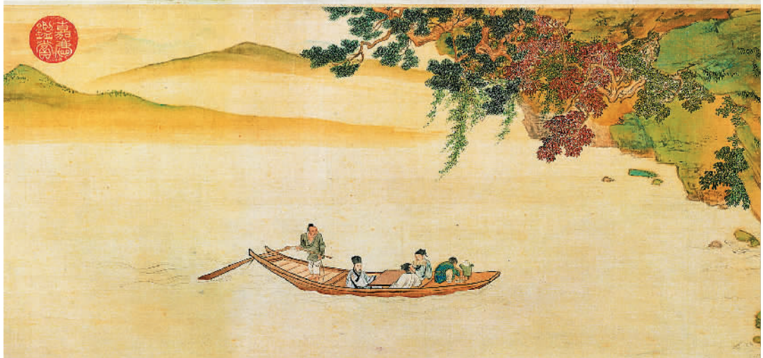
左图：《明仇英赤壁图卷》(局部)，右图：《北宋欧阳修行书谱图序稿并诗卷》(局部)