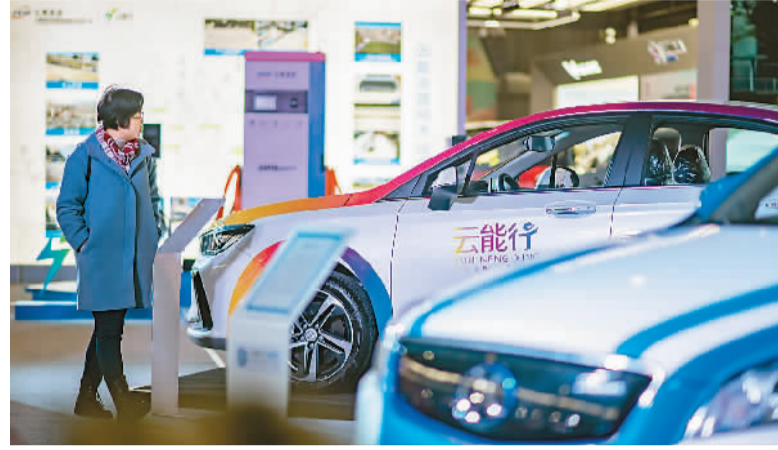
日前，新能源汽车下乡云南站活动启动仪式在昆明国际会展中心举行，来自北汽昆明分公司、东风云汽等企业参加了本次活动。图为前来参加活动的市民在现场参观。