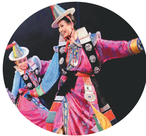
那达慕在蒙古语中意为娱乐、游戏。为庆祝丰收，蒙古国每年七、八月举办的那达慕大会，这是蒙古民族在长期游牧生活中流传下来的具有独特民族色彩的盛大节日，每年吸引大量来自世界各地的游客。图为身着民族服饰的蒙古国青年在那达慕大会上表演节目。

感受乌拉巴托的传统与现代、沧桑与年轻，游客一定会感慨：乌拉巴托的夜不静，但很美。 (海外网 吴正丹整理)