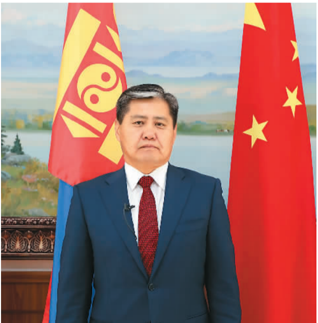
蒙古国驻华大使图布辛·巴德尔勒近照。