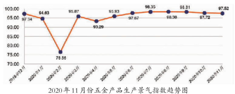
2020年11月份五金产品生产景气指数趋势图

11月份,五金产品生产景气指数收于97.52点,环比微幅下降0.20点,与去年同期基本持平。十二大类行业景气指数呈现八升四降格局,其中,厨用五金和电子电工类行业生产景气指数跌幅居前,环比分别下跌10.24点和6.75点。