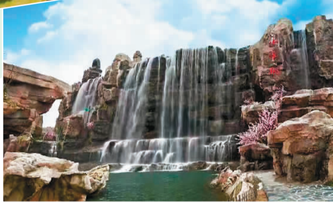
象山影视基地景观